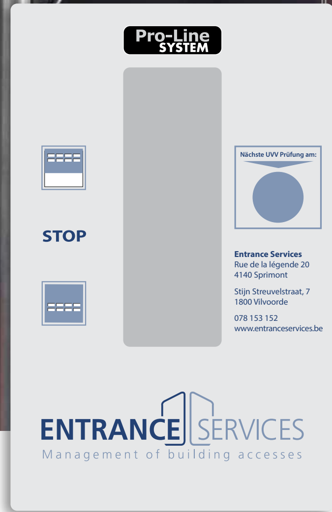
A Moteur Pro-Line Autocollant moteur