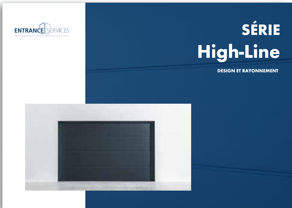
N High-Line Design et rayonnement Fiche produit